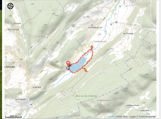
Sentier du lac de Lamoura

The trail goes around the lake. A wooden boardwalk allows hikers to cross the most humid areas and the peat bog without damaging these fragile environments.