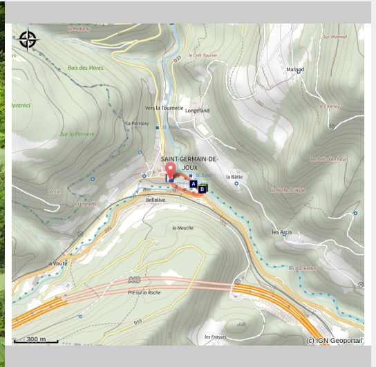
L'ancienne scierie

Depuis le village de St-Germain-de-Joux, cette courte balade descend dans les gorges creusées par la Semine pour découvrir de curieuses formations géologiques.