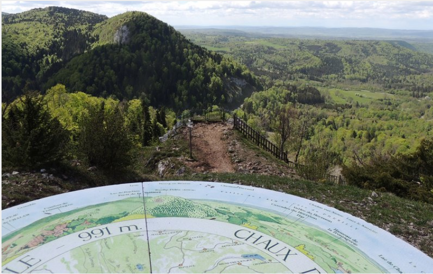
Le belvédère du Pic de l'Aigle