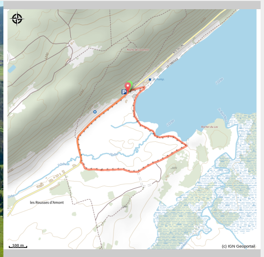
Lac des Rousses, Vallée de l'Orbe et Dent de Vaullion

Un platelage en bois permet de découvrir la tourbière et de s'immerger dans la diversité des paysages du lac durant cette courte excursion à la portée de tous.