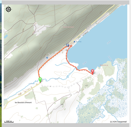
Lac des Rousses, Vallée de l'Orbe et Dent de Vaulion

Un platelage en bois permet de découvrir la tourbière et de s'immerger dans la diversité des paysages du lac durant cette courte excursion à la portée de tous.