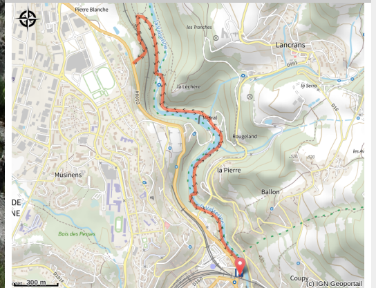
Pertes de la Valserine

Depuis le cœur de Bellegarde, cette promenade vous conduit dans les entrailles de la Valserine, affluent du Rhône.