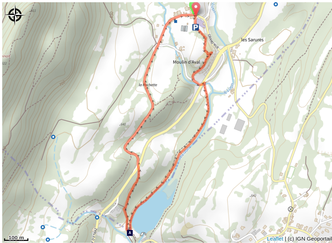
Le Lac de Cuttura (A)