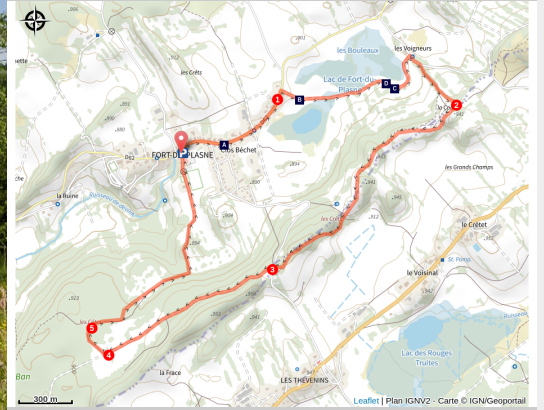
Tourbière de Fort-du-Plasne

Un passage sur les crêtes offre une vue inattendue sur les communes du Lac des Rouges Truites et de Fort du Plasne, leurs lacs et leurs tourbières.