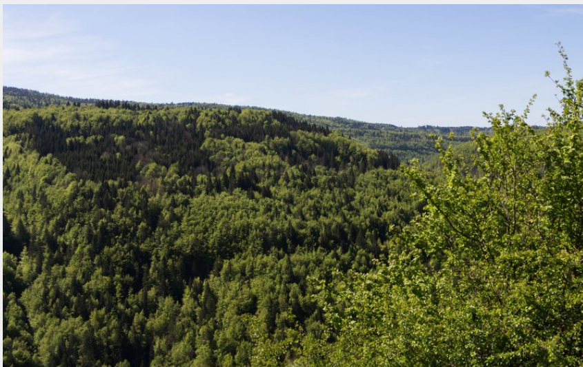
Point de vue