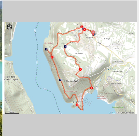
Lac de Vouglans

Depuis Maisod, dont le château accueille le poète Lamartine, cette balade facile vous offre de longer le lac de Vouglans et de vous imprégner des odeurs de bois de pins et de buis.