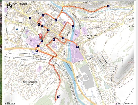
Pontarlier (PNRHJ) - F. Jeanparis)

En déambulant à travers les rues du centre historique, ce tour en ville vous révélera les lieux emblématiques de Pontarlier : bâtiments architecturaux, historiques et symboliques de la ville, en passant par les berges du Doubs et par un point de vue sur les hauteurs de la ville.