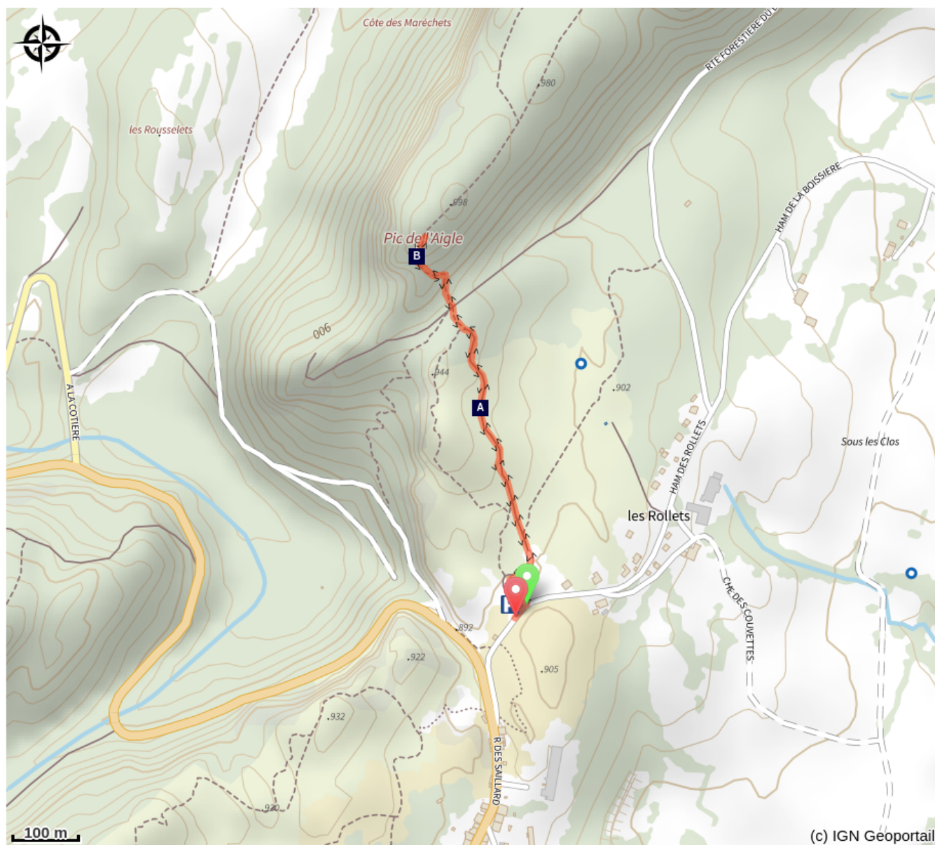
Les pelouses sèches (A)