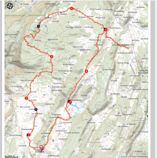
Vue sur Les Moussières

Les paysages traversés par ce circuit reflètent bien cette partie du Haut-Jura appelée les Hautes-Combes. Tout en creux et en crêtes, aux fermes éparpillées et aux troupeaux de vaches mouchetant le paysage, les Hautes-Combes sont un territoire typique des Montagnes du Jura où il fait bon se ressourcer à vélo.