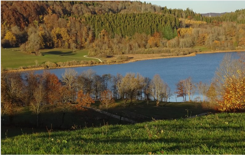
Lac de Narlay (CCPays des Lacs)