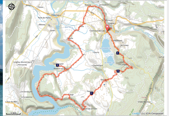
Lac de Clairvaux (OT Clairvaux-les-Lacs)

De Clairvaux à Vouglans, le calme des lacs et forêts