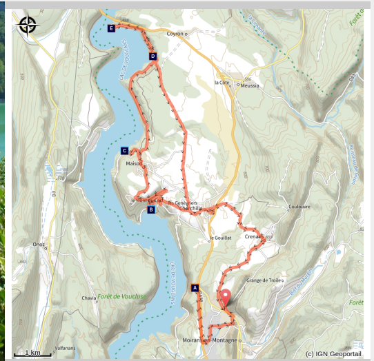
Lac de Vouglans (Clara BURTIN)

Des eaux turquoise du lac aux forêts et belvédères.