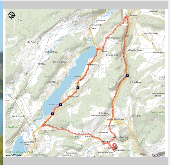
Lac de Saint-Point (Daniel Bouthiaux)

entre paysages, sources mystérieuses et rives du lac