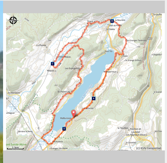
Lac de Saint-Point (Daniel Bouthiaux)

Du grand lac de Saint-Point au trésor méconnu de Malpas