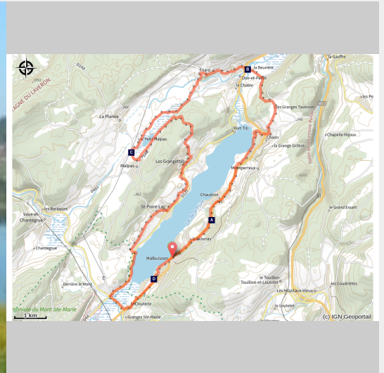
Lac de Saint-Point (Daniel Bouthiaux)

Du grand lac de Saint-Point au trésor méconnu de Malpas