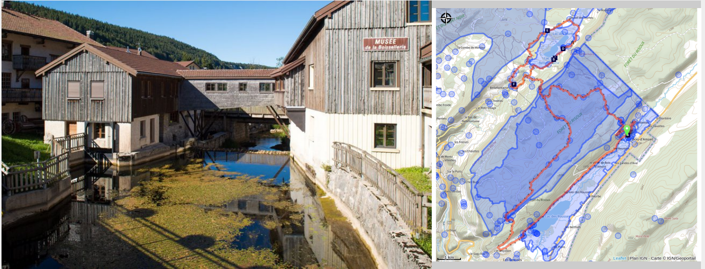
Musée de la Boissellerie (Benjamin Becker)