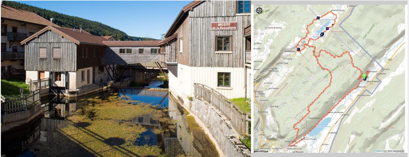
Musée de la Boissellerie (Benjamin Becker)