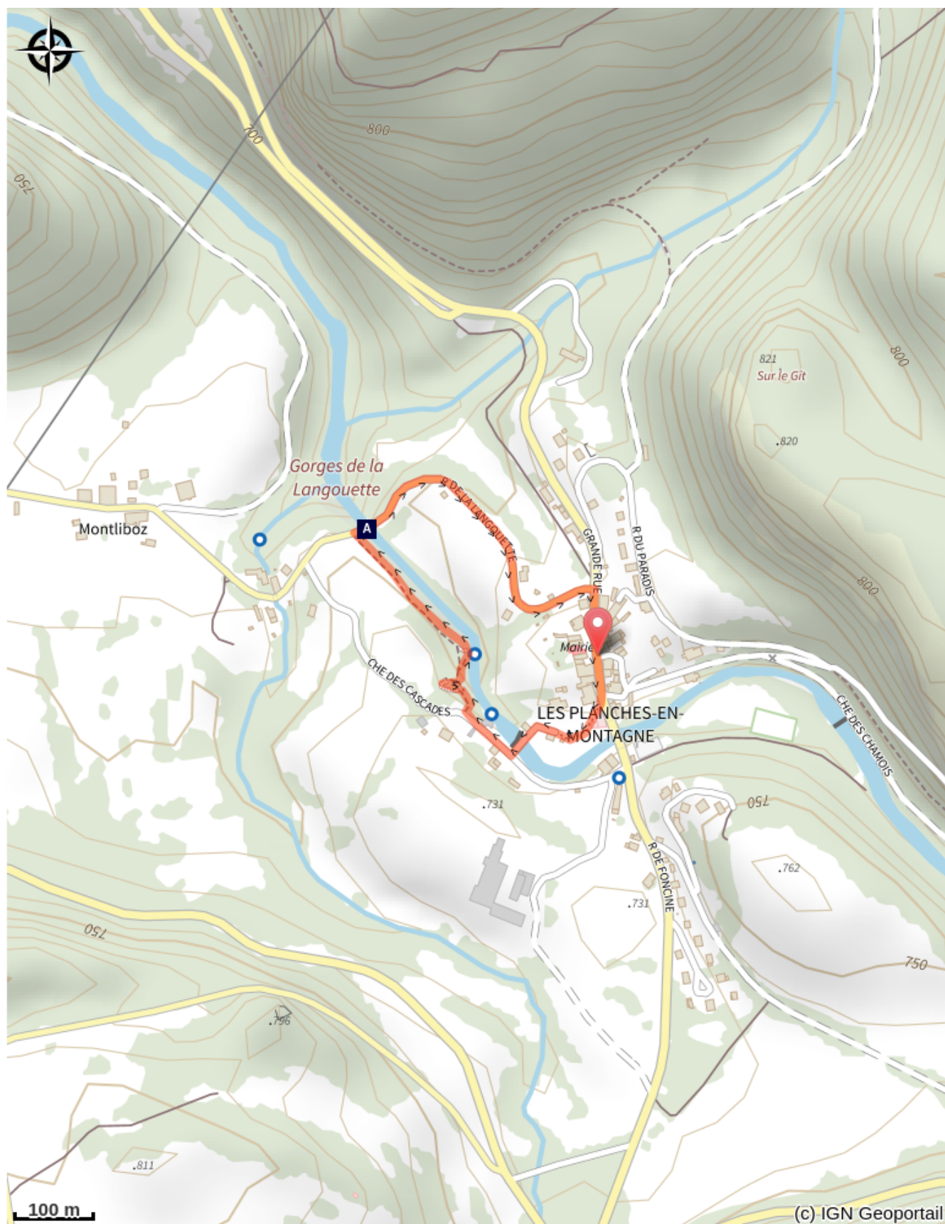
Les gorges de la Langouette (A)