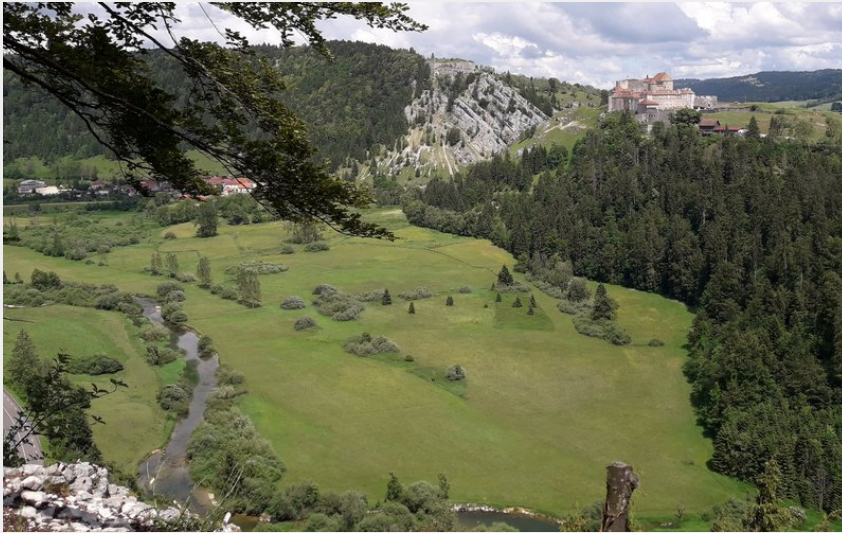
Belvédère des Granges (CCGP)