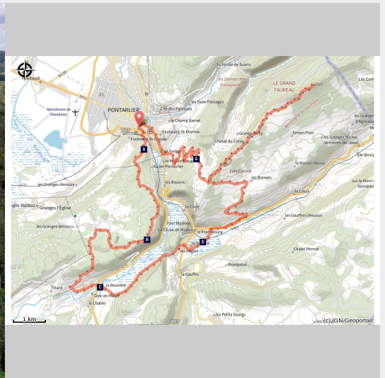
Belvédère des Granges (CCGP)

De la forêt du Laveron au sommet du Larmont