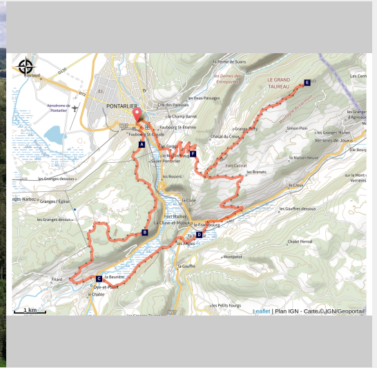
Belvédère des Granges (CCGP)

De la forêt du Laveron au sommet du Larmont