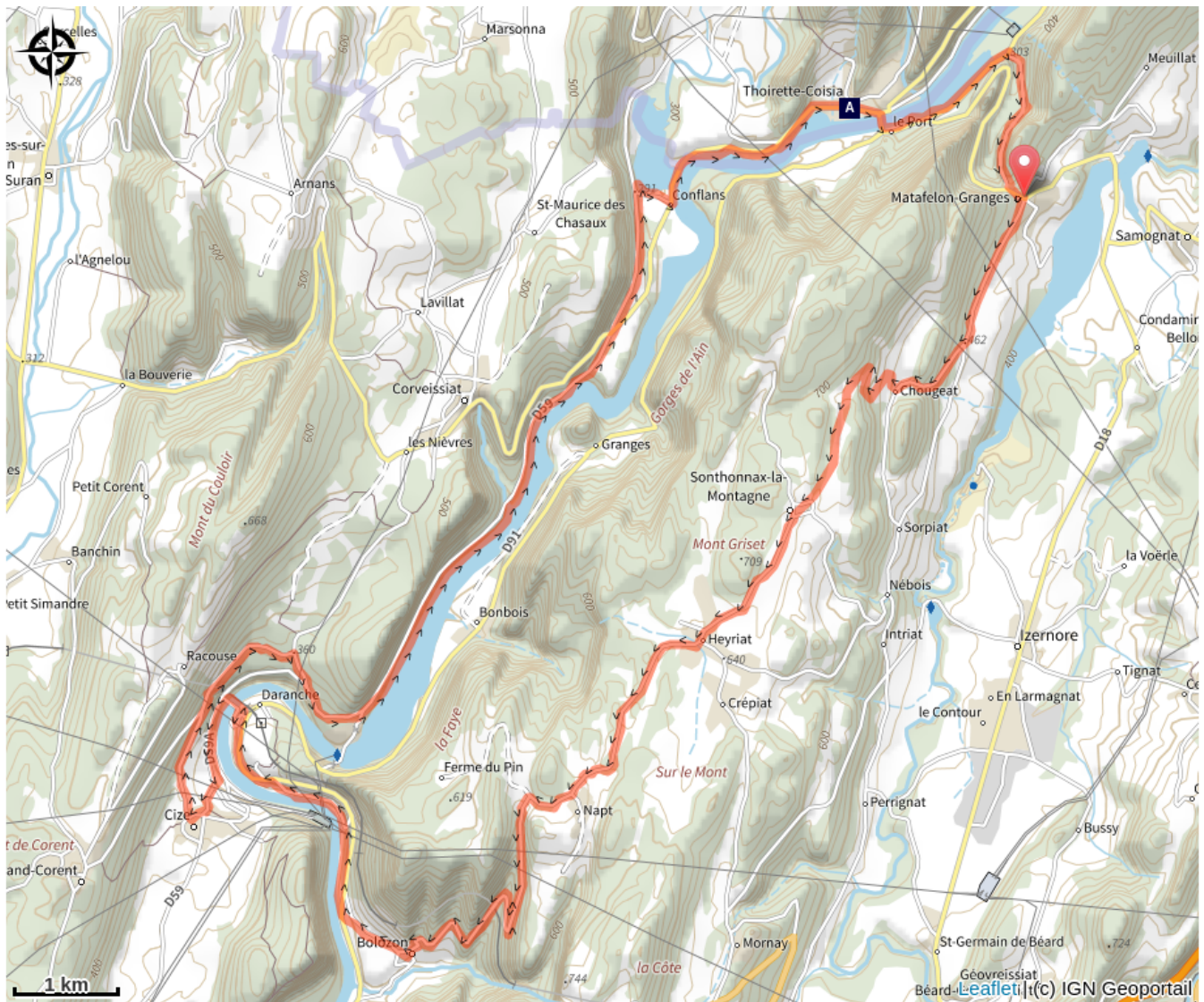
La Lône (A)