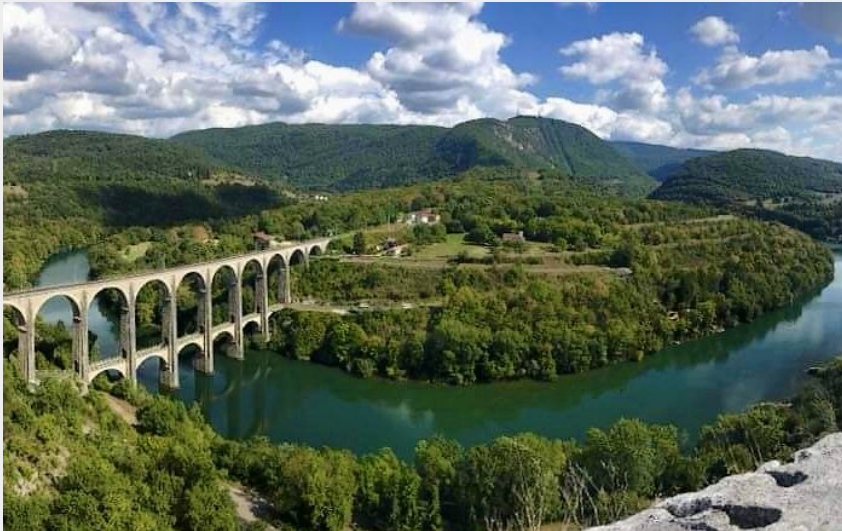
viaduc de Cize