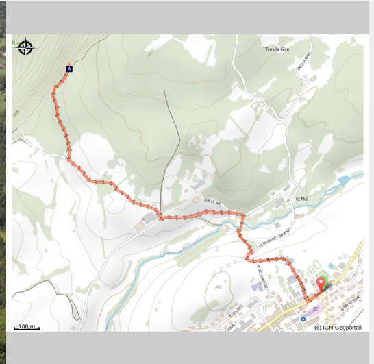
Vallée de la Bienne