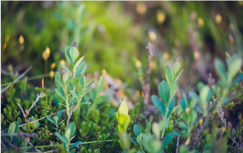
Airelle des marais