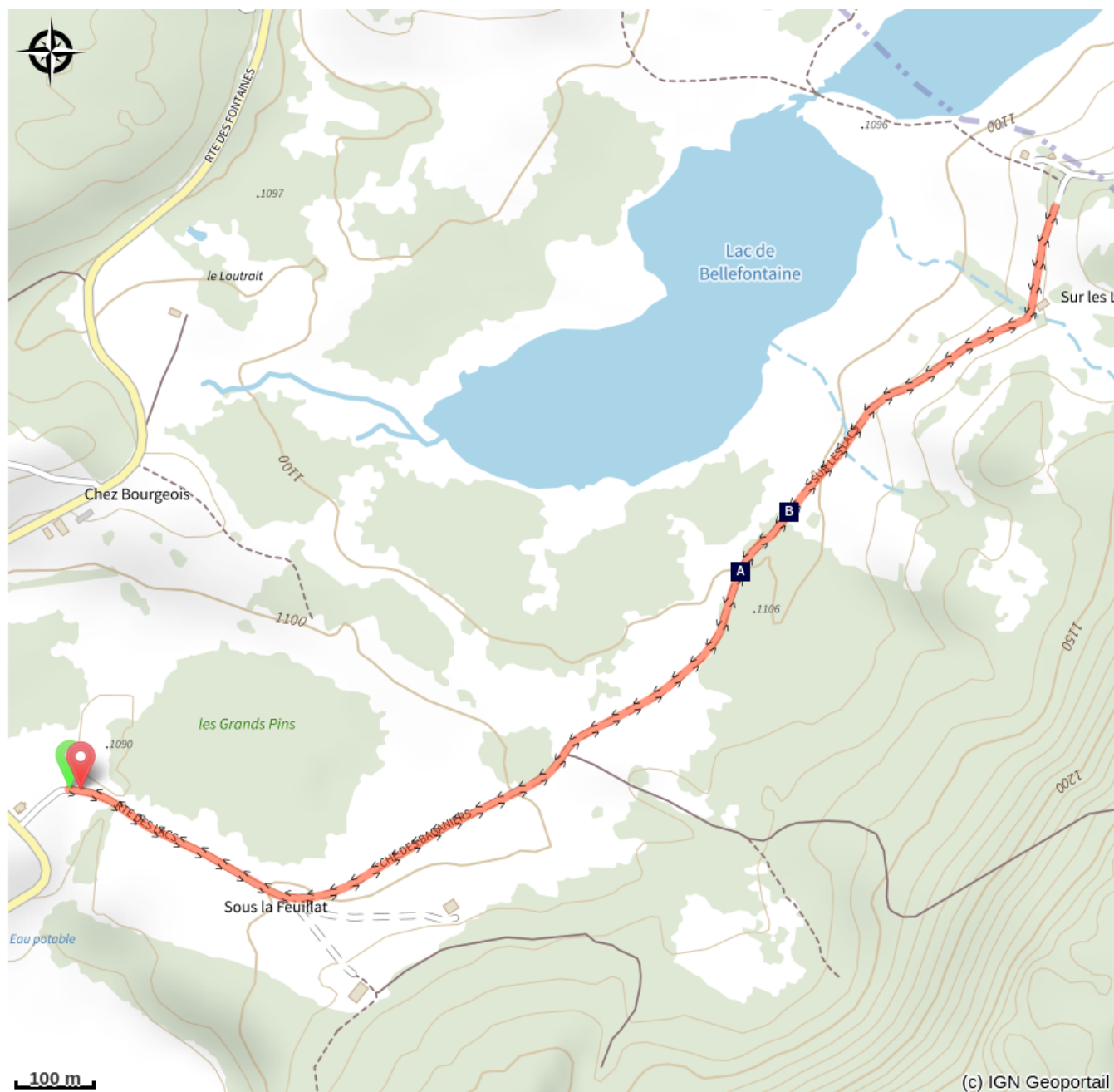
L'Airelle des marais et le Solitaire (A)