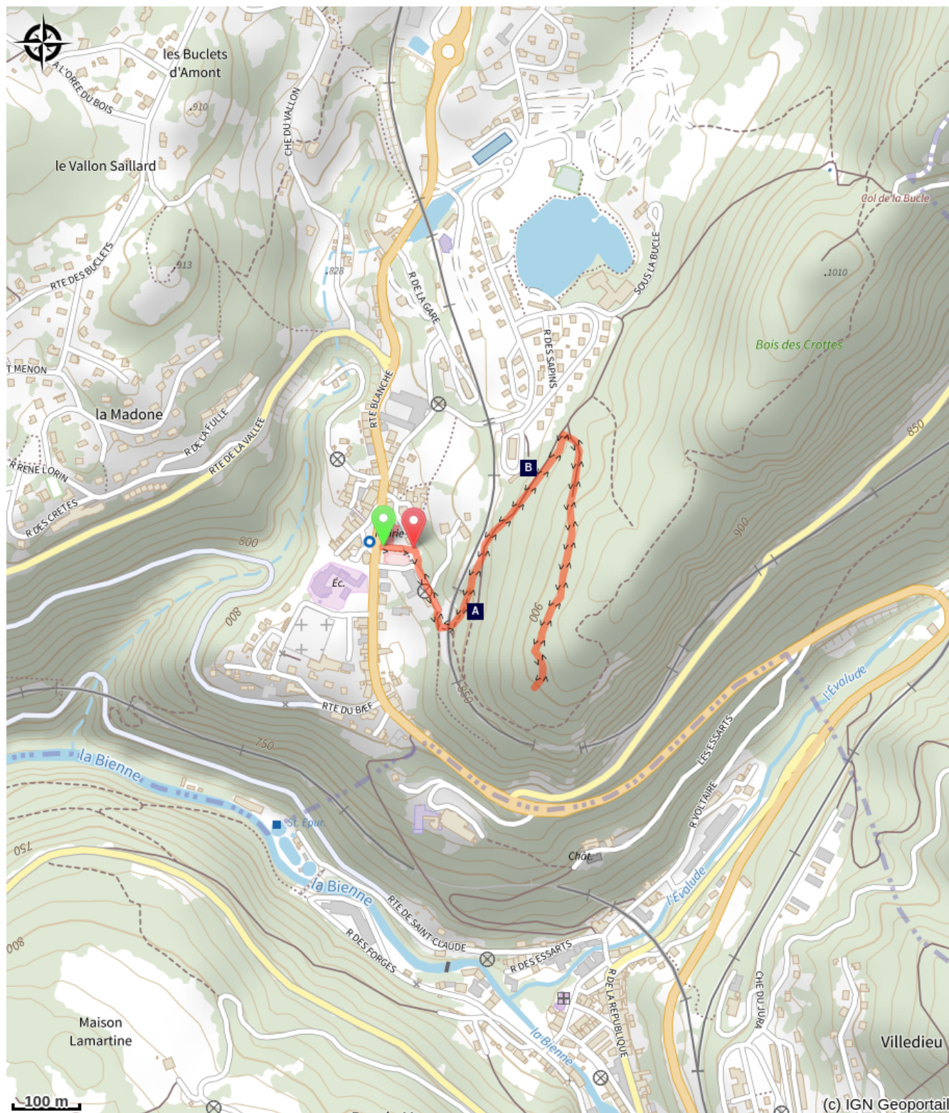
Église de Morbier (A)