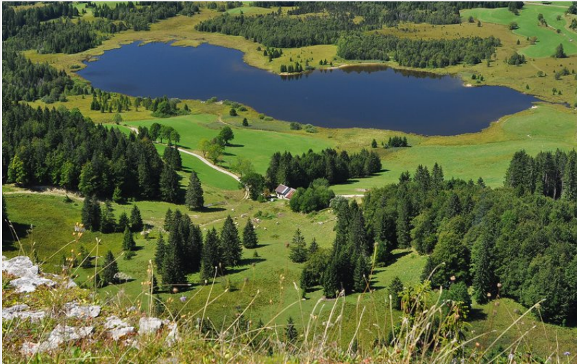
Vue depuis Roche Bernard (Jack Carrot)