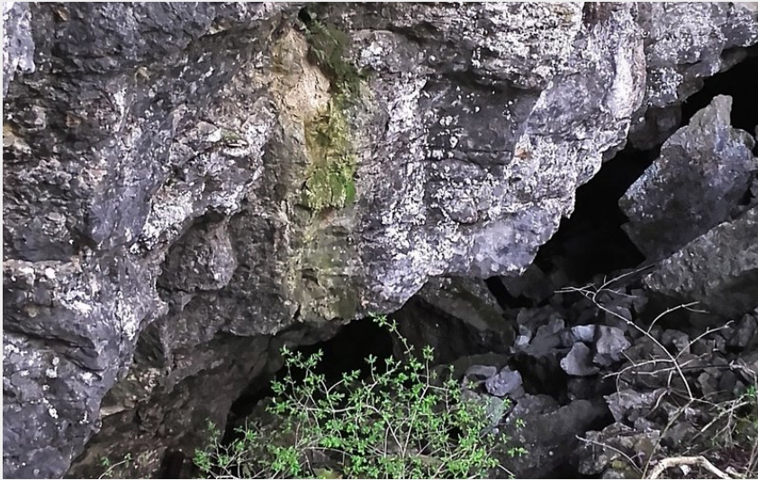
Perte du lac