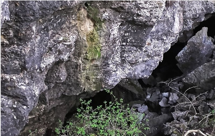
Perte du lac