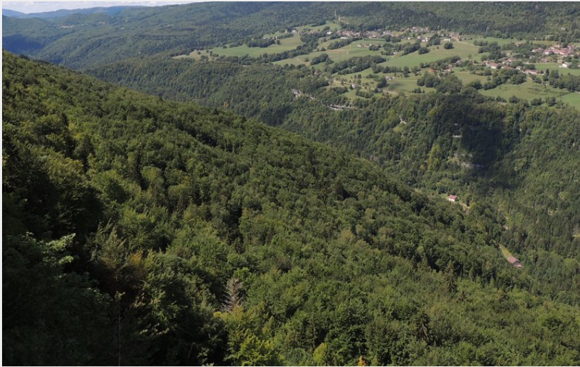
Vallée de la Bienne