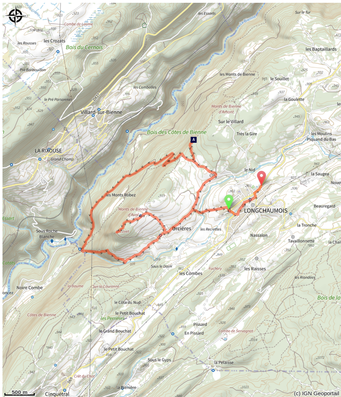
Vallée de la Biemme (A)