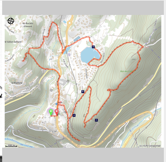
Église de Morbier