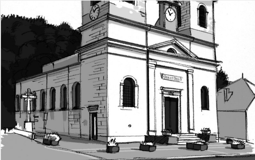
Église de Morbier (PNRHJ / Roman Charpentier)