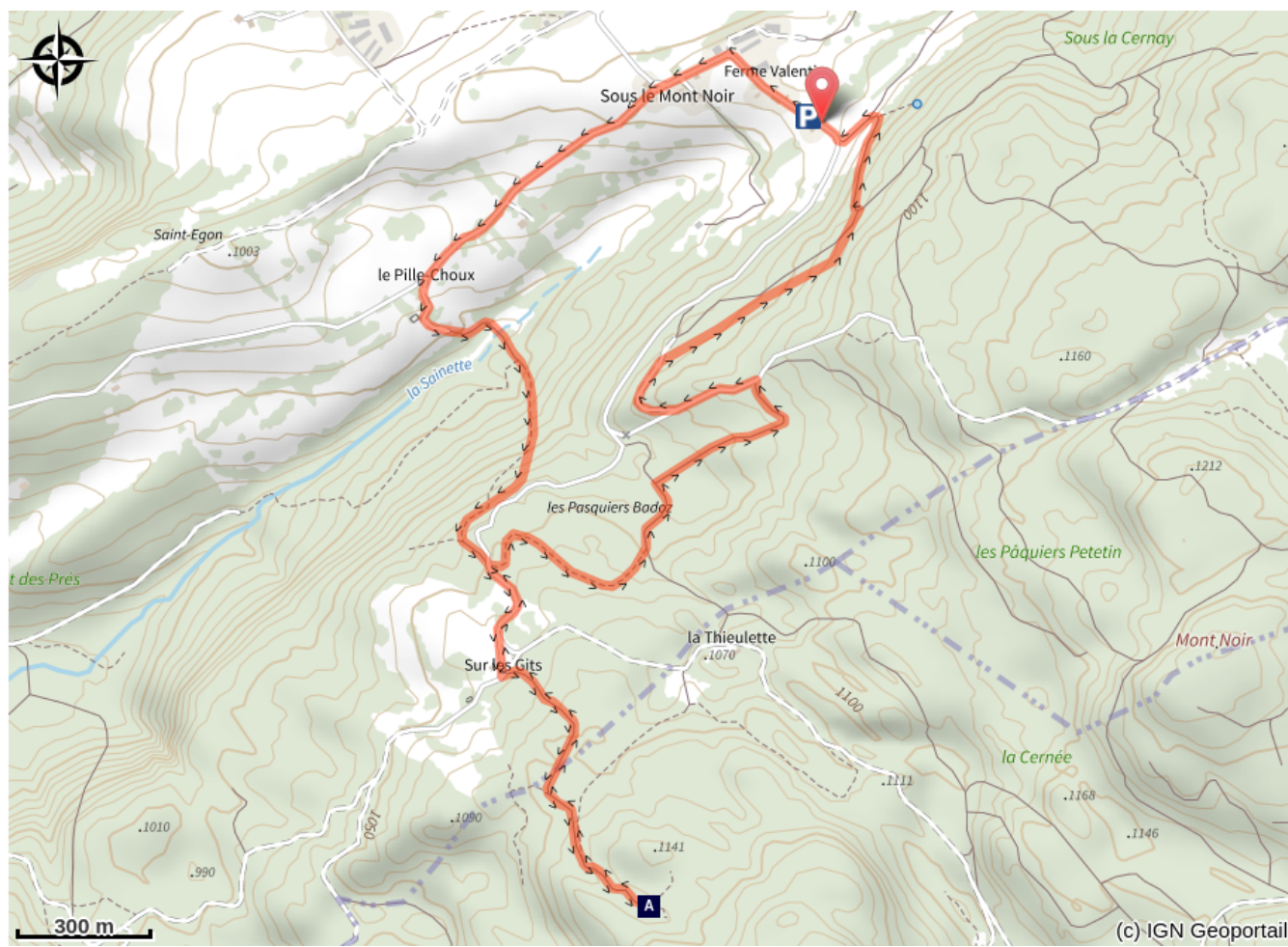
Le Creux Maldru (A)