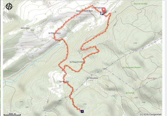
Creux Maldru

La baume « Creux Maldru » passe pour avoir été un asile introuvable en des temps de guerre et persécutions religieuses. Des prêtres réfractaires y trouvèrent refuge lors de la révolution française.