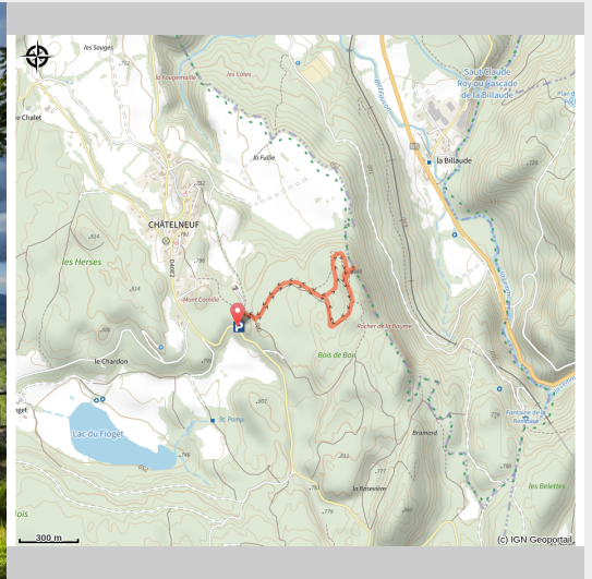
Belvédère du Rocher de la Baume

Circuit pour découvrir le belvédère du Rocher de la Baume, différents villages et le château de Syam. Une table de lecture permet d'appréhender la richesse des paysages ainsi que l'histoire celte de ce secteur.