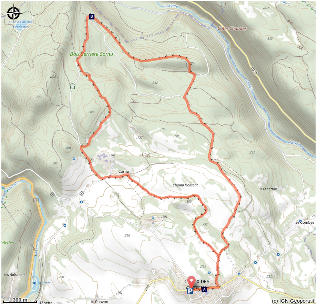
Mairie de Chaux-des-Crotenay (A)