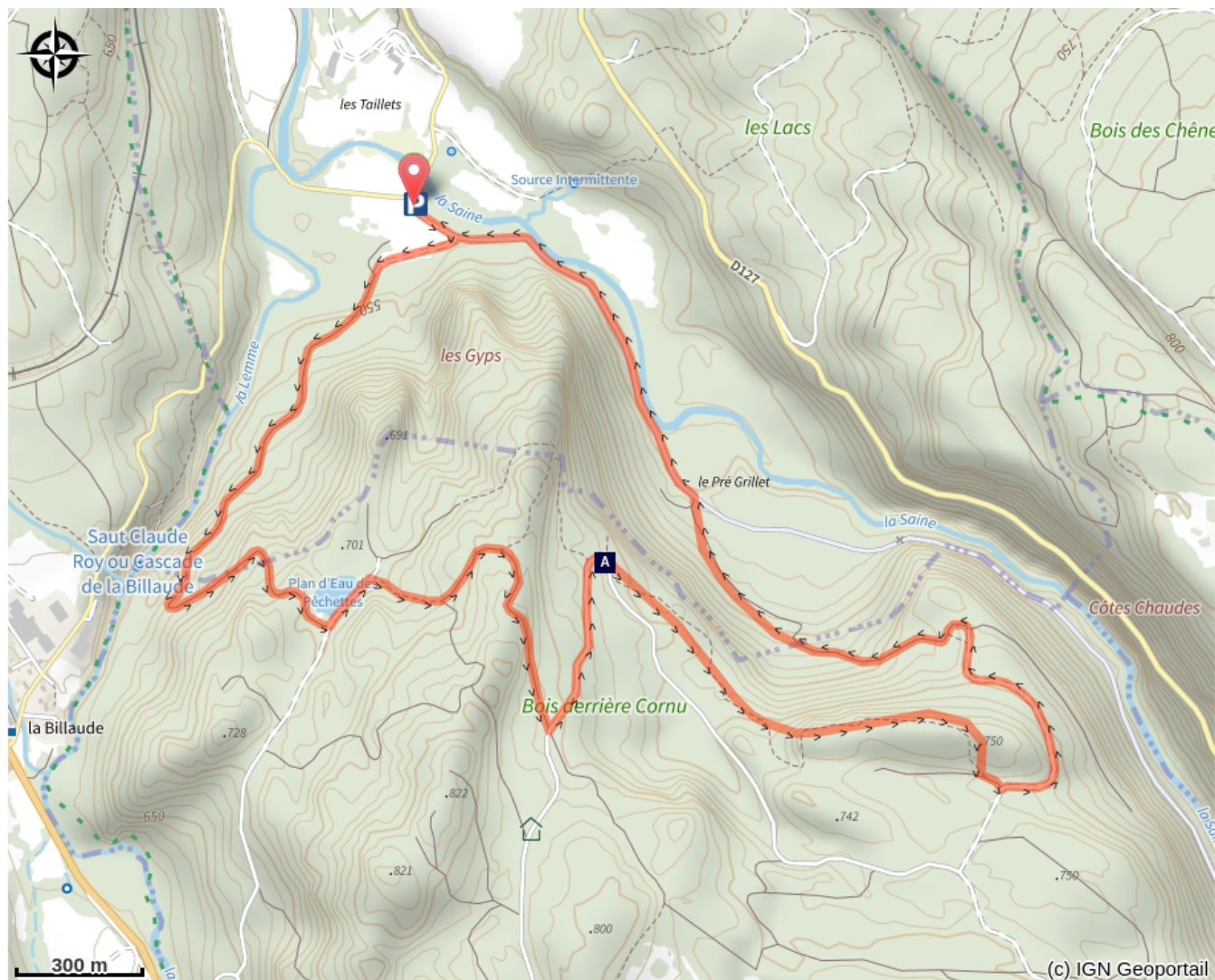
Belvédère des Prés Grillet (A)