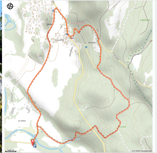
Roche des Sarrasins (CC CNJ)

Circuit qui vous fait découvrir des curiosités historiques et géologiques autour du petit village pittoresque de Syam.