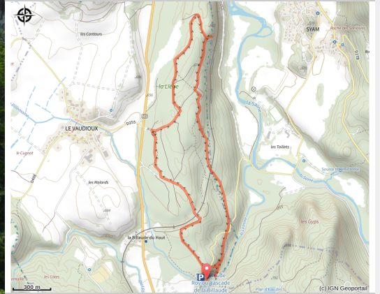
Cascade de la Billaude depuis le belvédère (CC CNJ)

Circuit qui vous fera découvrir le belvédère de la Billaude donnant une vue spectaculaire sur la cascade et le belvédère des 3 vallées.