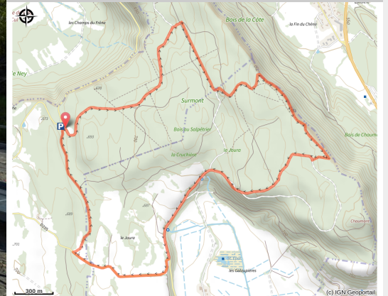
Site de pistes à dinosaures de Loulle

Circuit pour découvrir plusieurs belvédères permettant d'avoir de magnifiques vues sur le territoire, Lapiaz et le fameux site de Loulle où des pas de dinosaures ont été découverts !