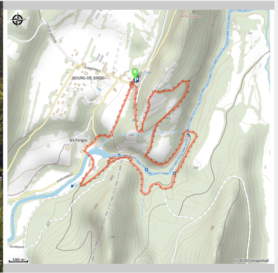
Pertes de l'Ain

Circuit pour découvrir une curiosité principale de la région : les pertes de l'Ain, site remarquable aménagé (tables de lecture) fortement marqué par l'histoire du pays, l'évolution de son industrie et la richesse naturelle et chaotique des lieux !