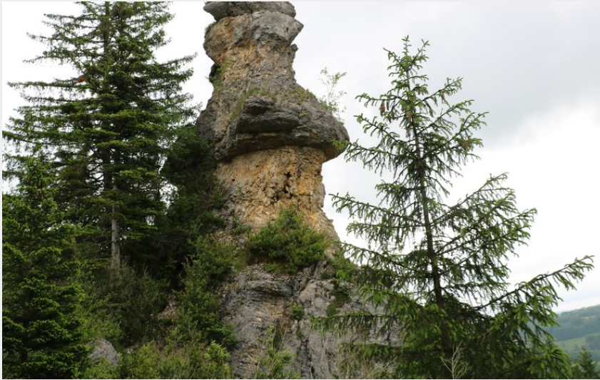
Rocher des Commères à Sirod (CC CNJ)