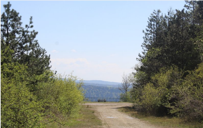
Mont Rivel (CC CNJ)