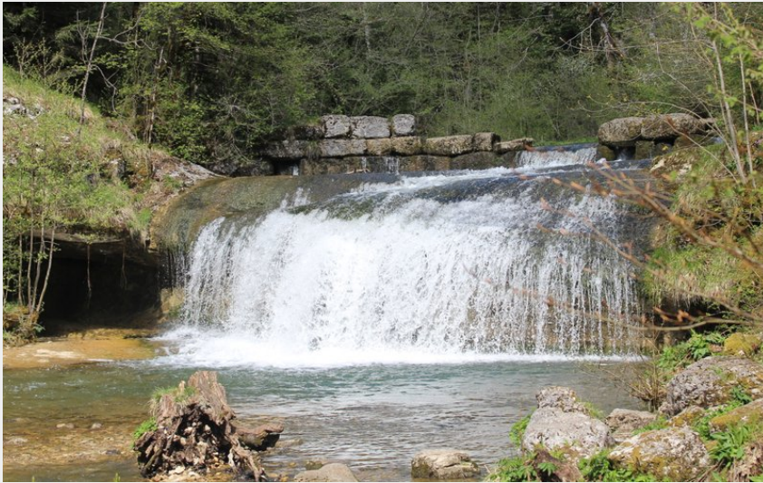
Moulin Jeunet cascades du Hérissou (CC CNJ)