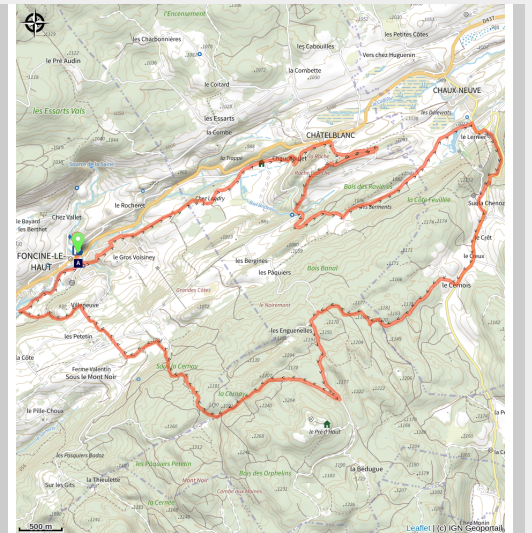
Foncine-le-Haut (CC CNJ)