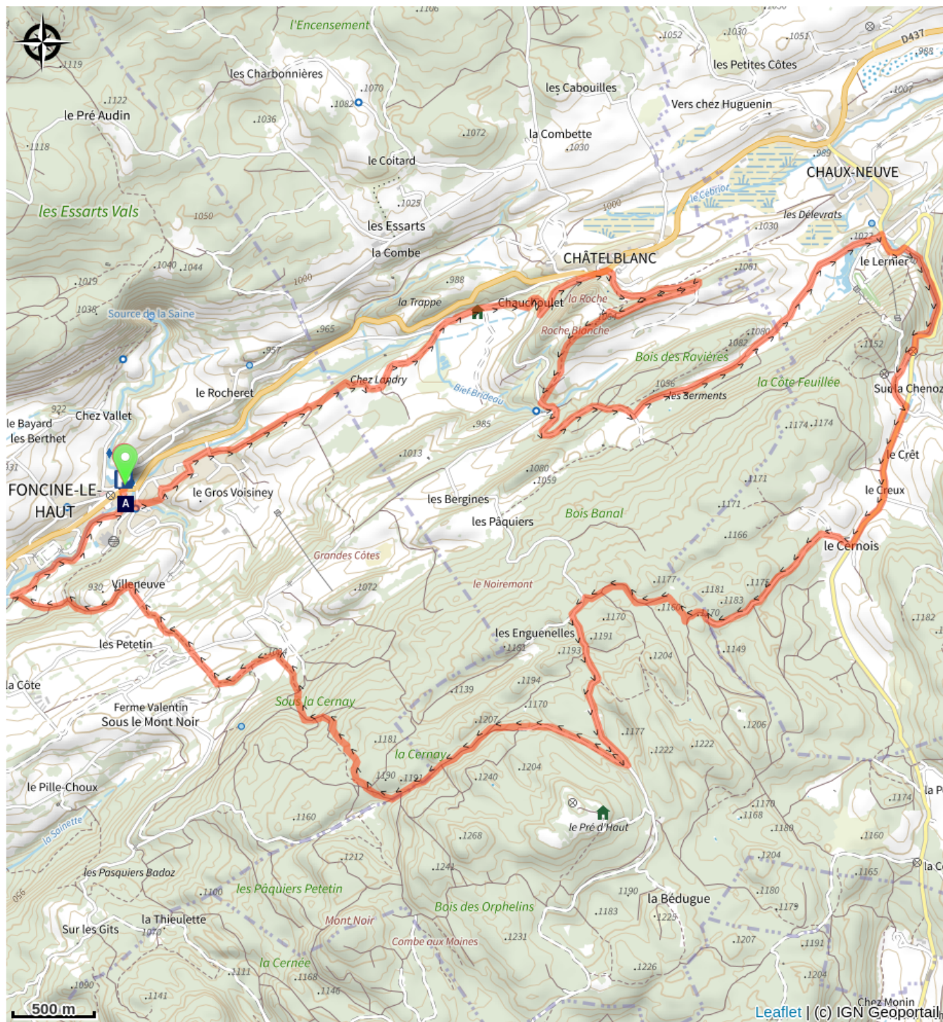
La Truite fario (A)