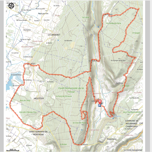
Belvédère du Signal Les Nans