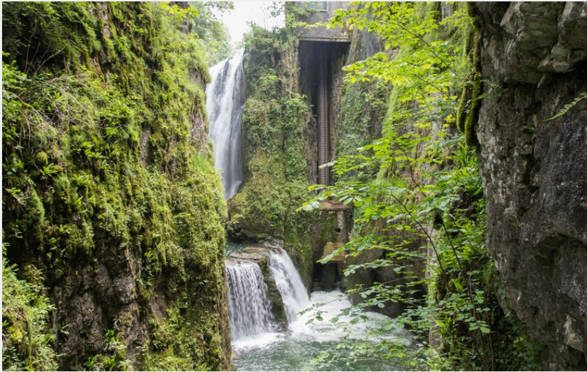
Gorges de la Langouette