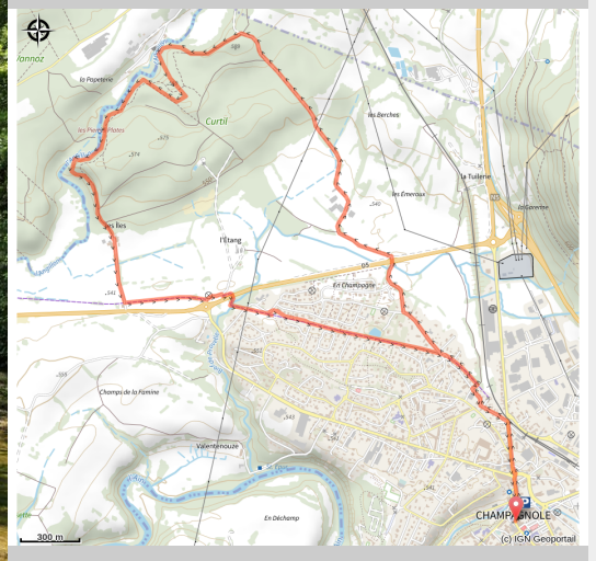
Pierres plates, l'Angillon à Champagnole

Circuit pour faire la découverte du milieu agricole sud-urbain, et de l'Angillon, rivière propice à la pêche à la truite.