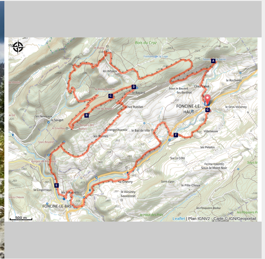
Belvédère du Bulay (Frédérique Modolo)

Un parcours sauvage qui, après la source de la Saine, vous fera basculer dans la combe des Entrecôtes en passant par le belvédère du Bulay. Vous visiterez ensuite le bief de la Ruine et son secteur préservé jusqu'à Foncine-le-Bas. La remontée à Foncine-le-Haut se fera par des chemins forestiers et pâtures. Cet itinéraire peut être couplé avec le Parcours F si vous souhaitez faire une longue sortie.