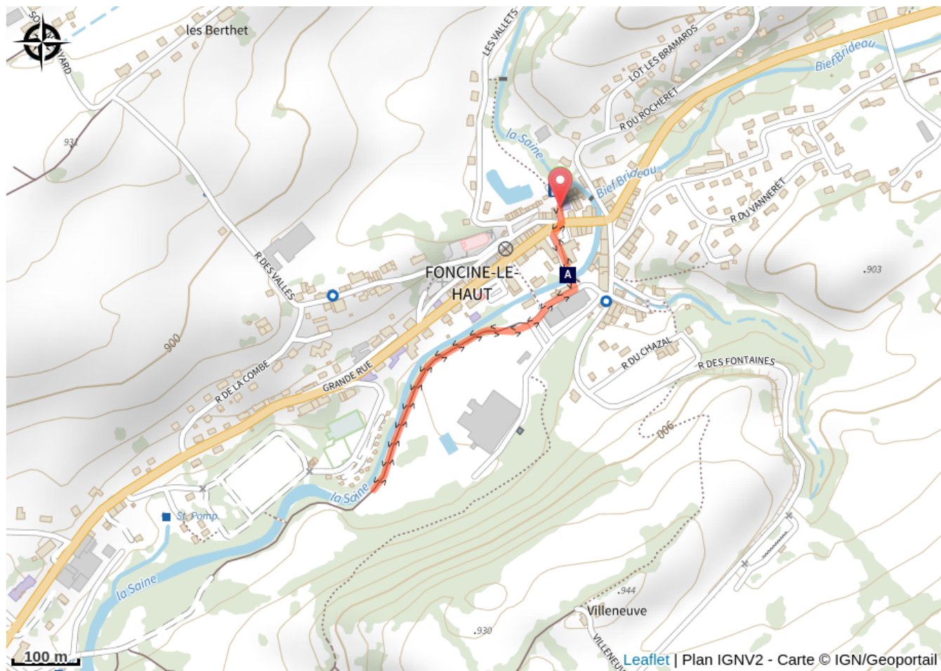
La Truite fario (A)